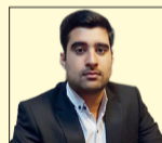
محمد زاده‌زهر دبیر کل اتحادیه جامعه اسلامی دانشجویان